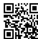
▲環境情報センターHP