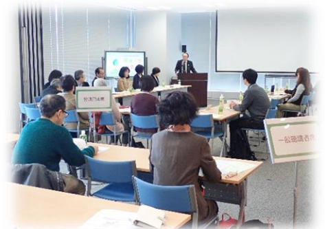
▲昨年度の発表会の様子